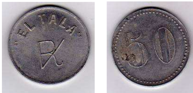
Fichas de 1 y 50 vellones, acuñadas en aluminio por la Casa Barés, empleadas para el pago de la esquila en la estancia.

Apreciando la ventaja que significaba tener caballos adiestrados, para correr en un campo llano como “guanacos” (con los pares de boleadoras enredadas en las patas) mantuvo siempre una tropilla de estos animales en “El Tala”.