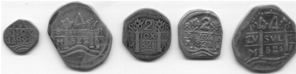
Piezas falsas de macuquinas de Chilecito.

En éste año se hizo un nuevo intento de fabricar monedas redondas a imitación de las piezas porteñas de cobre. La reducida acuñación muestra un tosco escudo nacional en el anverso, y en el reverso, la inscripción RIOXA dentro de una guirnalda, rodeada de la leyenda SVR AMERICA, la fecha y el número 1 del valor. Actualmente solo se conocen 1 pieza en oro y dos en plata.