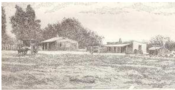
Casco de Estancia en Bueno Aires hacia 1870