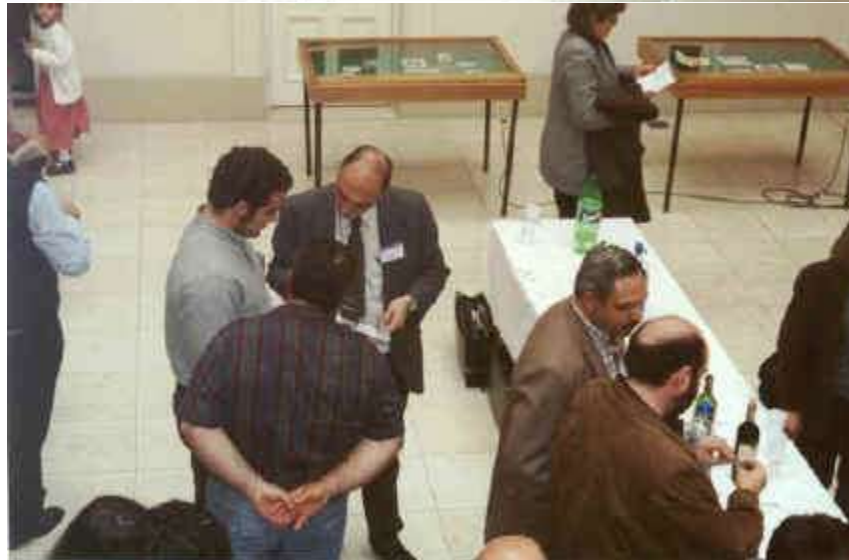
Las fotos fueron tomadas en la Bolsa de Comercio de Bahía Blanca, el domingo 10 de octubre de 1999. Se pueden apreciar las vitrinas en donde el Banco Central de la República Argentina y el Banco de la Ciudad de Buenos Aires expusieron valioso material numismático.