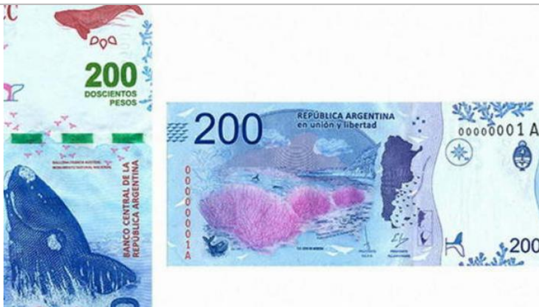
BILLETE ORIGINAL. Debe apreciarse el logo del mapa de la República y la Antártida Argentina.

Especialistas advirtieron a la población cómo es la imagen real del billete, ante posibles falsificaciones.