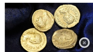
OBJETOS DE DESEO. La numismática antigua reúne a coleccionistas y comerciantes en búsqueda de piezas, en su mayoría, anteriores al siglo XVI. Aquí, cuatro monedas del Imperio romano.

Coleccionistas que hablan de una pasión cada vez más vigente. Secretos de especialistas y consejos para iniciados.