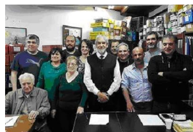
Comisión Directiva CEFINI 2017

Siendo las 17,30 hs., se da por finalizada la Asamblea.”