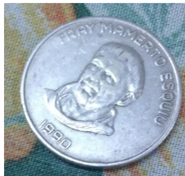
Premio de la rifa en vivo – El Esquiú 15 gr. Plata 900

El día 25 de mayo se realizó una reunión extraordinaria de canjes, rifas y subastas en vivo. Conmemorando un nuevo aniversario de la Revolución de mayo.