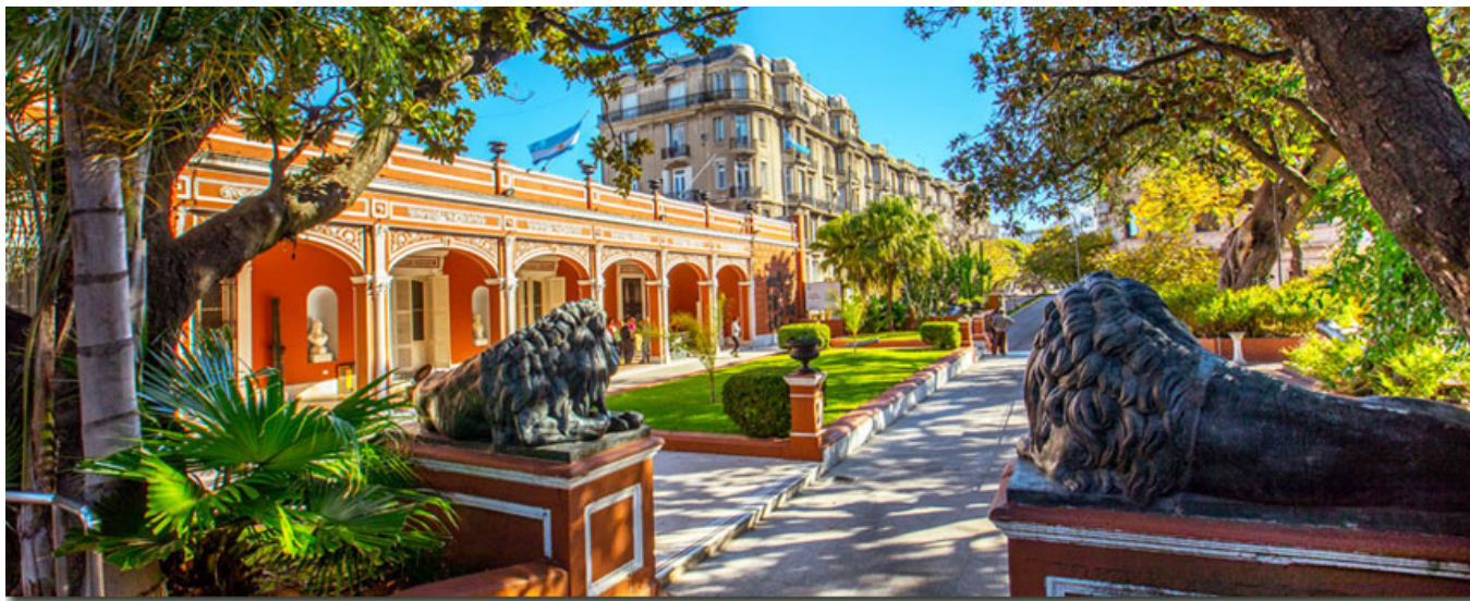
Vista del Museo Histórico Nacional