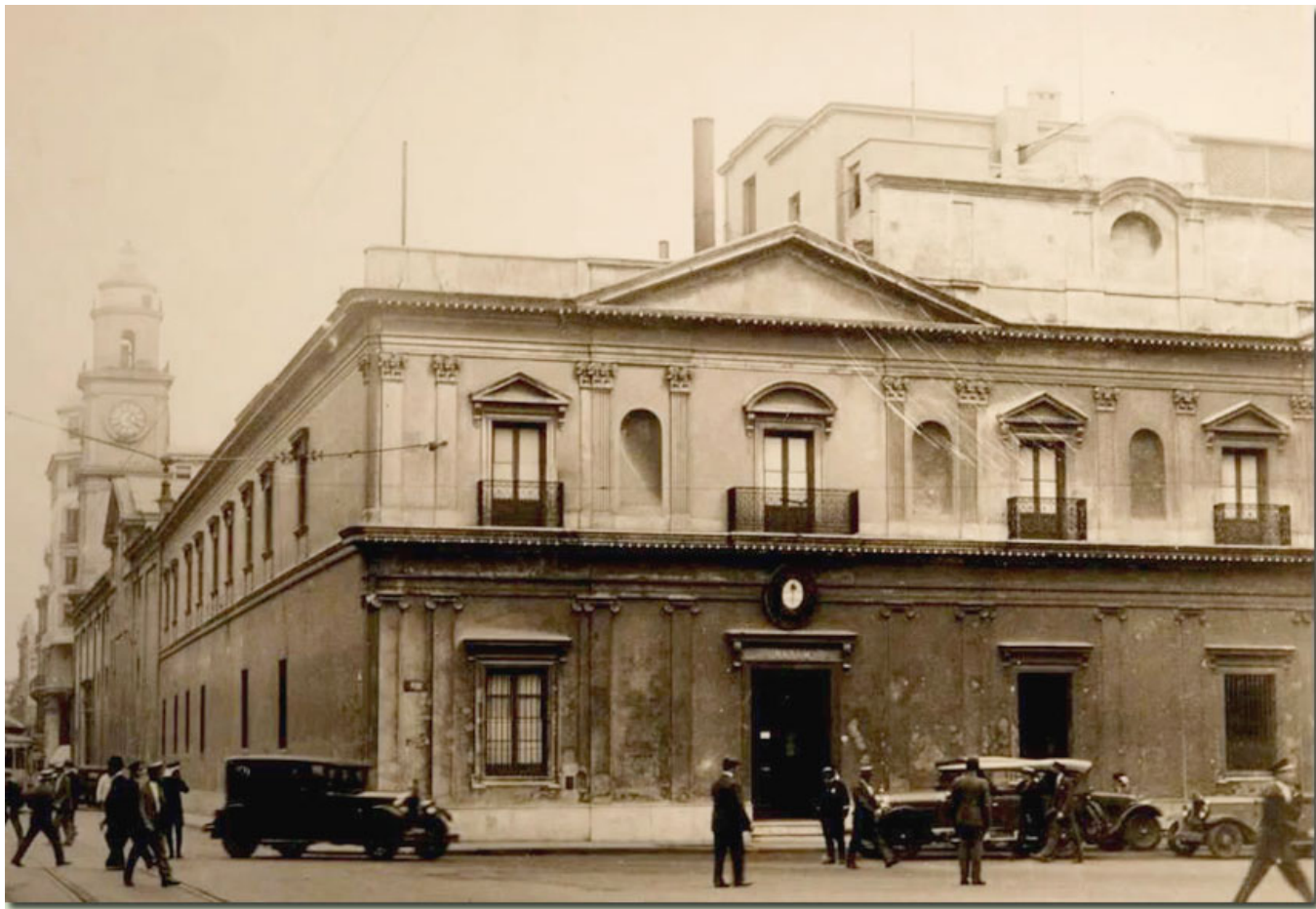
El Museo Nacional de Ciencias Naturales en su ubicación original ("Manzana de las Luces") a comienzos de la década de 1920, época en que aún albergaba la colección