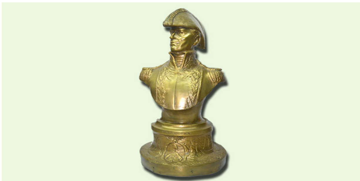
Busto de Bronce – alto 30 cm. fundido en la Escuela de Mecánica de la Armada