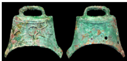
CHINA, ZHOU Dynasty, 1122-255 BC, bell, thin handle, 39x36mm, 8.5g, starburst design, sandhole, VF $36.00 sold 7/19/07