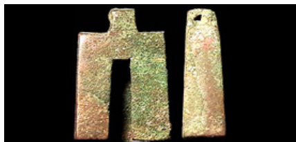
CHINA, ZHOU Dynasty, 1122-255 BC, "lotus root heart money," 32x9x9mm, 16.7g, squared bell shape, slot on side, hole at top, maybe these were keys, in which case, what happened to the locks?, $98.00 (sold)