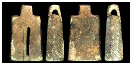
CHINA, ZHOU Dynasty, 1122-255 BC, "lotus root heart money," 25x17x8mm, 8.8g, squared bell shape, slit in one wall, loop at top, F $65.00 sold 3/3/2012