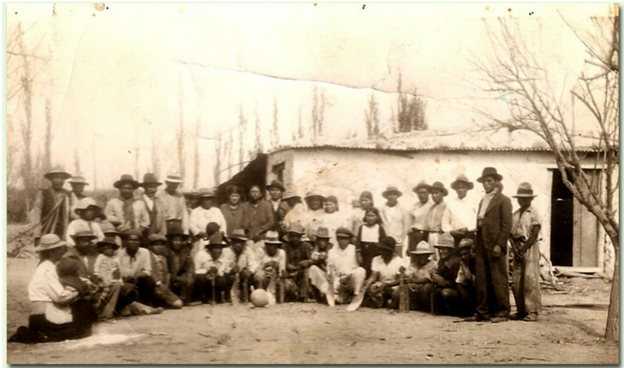
Ingenio San Isidro

Las condiciones de vida del personal han mejorado muchísimo desde 1914 hasta ahora, facilitándose a los obreros viviendas en forma gratuita. Los propietarios del ingenio donaron terrenos para edificar el "Barrio Obrero del Azúcar". El Hospital de Zona General Güemes, el "Aero Club" y han instituido además algunas becas de estudio en la Universidad Católica de Salta.