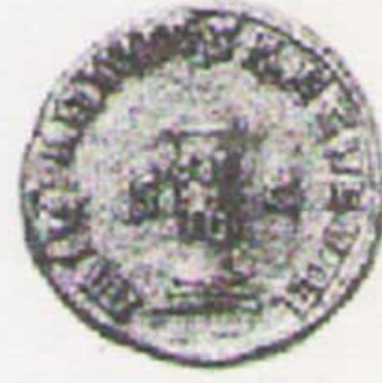
Filipo I - As (Bronce) - 248 AD

los que tuvieron particular importancia en Roma fueron los ludi saeculares que habían de tener lugar una sola vez cada siglo, pero fueron celebrados a distancias muy irregulares. Famosos fueron los celebrados por Augusto en el 17 a. C. de los cuales Horacio fue poeta oficial.