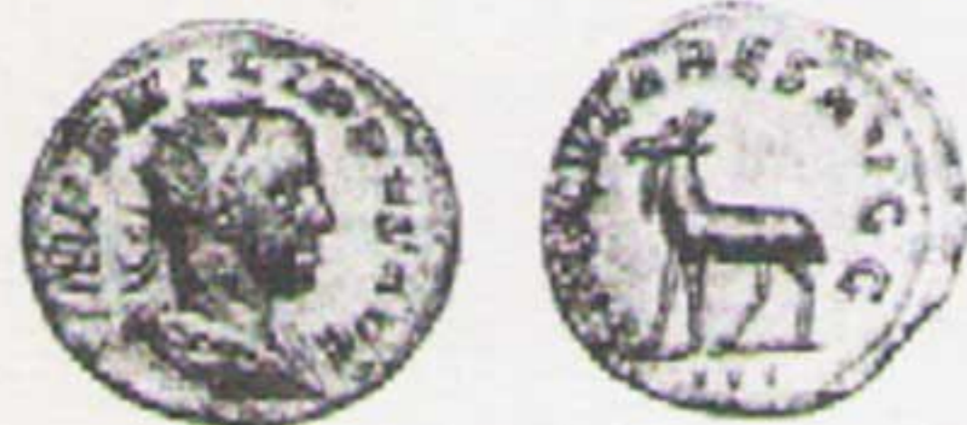
Filipo II, como César - Antoniniano (Plata)

León caminando a derecha (también a izquierda); gacela; antilope, cabra, hipopótamo (en las monedas de Otacilia Severa únicamente). Otras variantes presentan en lugar de animales a Rómulo y Remo mamando de La Loba Madre y otros una columna con la inscripción COS III, referido a la declaración