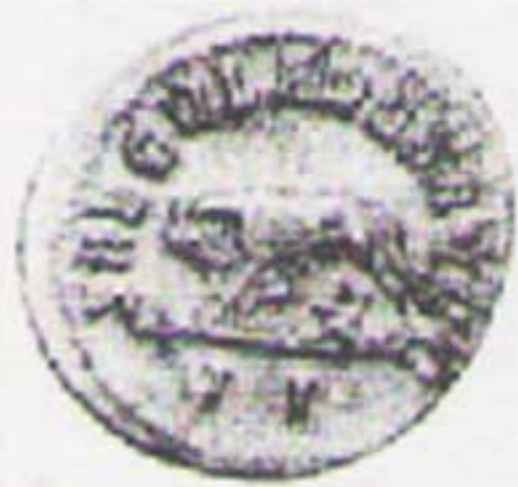
Filipo I Antoniniano (Plata)

El reinado de la familia imperial duró solamente cinco años, ya que en el 249 Filipo fue muerto en batalla en el norte de Italia, y su hijo asesinado en Roma a manos de la guardia pretoriana. A pesar de esto su gobierno fue notable porque en él Roma pasó por un importantísimo acontecimiento dentro de su historia; en el año 248 (1000-1001 AUC) se cumplieron mil años de la fundación de la Ciudad.