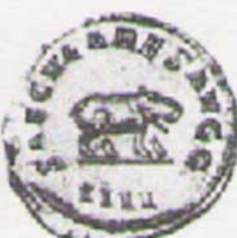
Otacilia Severa, esposa de Filipo I Antoniniano (Plata)