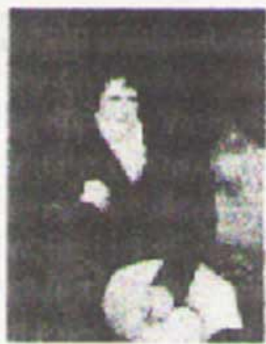
Muestra Histórica Belgraniana