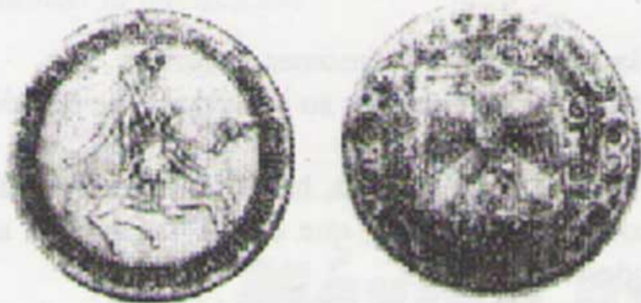
Rublo de 64 kopeks, 1654 (plata) Reproducción moderna. (H.M.F. Schulman, Nueva York, 1960, N° 2035)

bautizados yefimki 4 en Rusia o, también, táleros holandeses del león ( leewendaalder ) llamados levok (de lev , león) por los rusos. Estas monedas eran adquiridas por el gobierno a razón de 48 ó 50 kopeks cada una y puestas en circulación a 64 kopeks. Se conoce también piezas alemanas reselladas en 1654 con el tipo del zar a caballo en el anverso y el águila bicéfala en el reverso, pero los ejemplares existentes en la actualidad son muy escasos 5 .