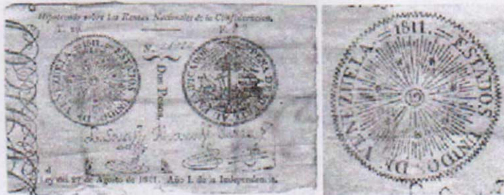
2 pesos Ley del 27 de agosto de 1811

Pero no sólo en las monedas aparece el sol: también se emitieron billetes con este símbolo en 1811. Según lo establece la disposición 3ª de la Ley del 27 de agosto de ese año, los billetes «contendrán el sello de la Confederación, la inscripción Estados Unidos de Venezuela , y su valor particular». Se imprimieron en varios valores y en diferentes emisiones. Los que nos interesan son los de 2, 4, 8 y 16 pesos.