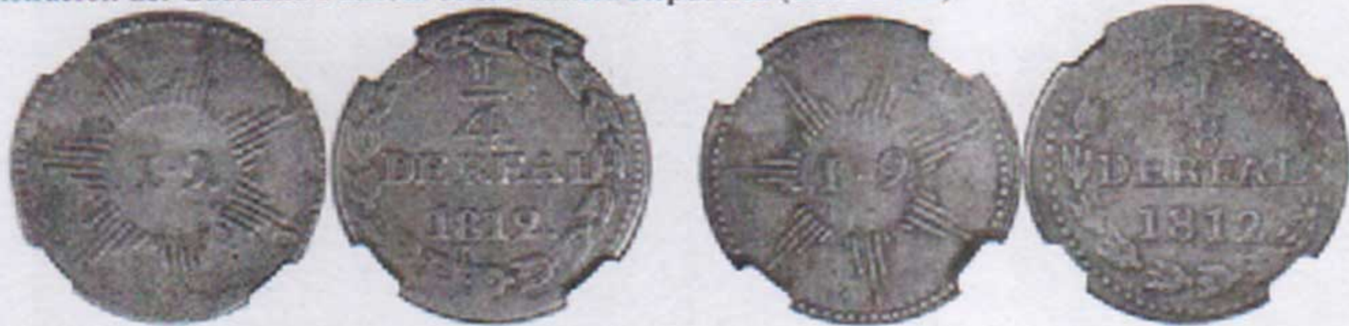
Cuartillo patriota de 1812

Se trata de las primeras emisiones independientes de Venezuela acuñadas durante un breve lapso en 1812, bajo la administración del Gobierno Patriota de la Primera República (1810-1812).