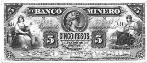
Izquierda: Imagen de la Diosa Themis en el billete del Banco Minero de 5 pesos (Chihuahua, México, 1 de agosto de 1914). 1

se la sitúa sobre un león para señalar que la justicia debe estar acompañada de la fuerza.