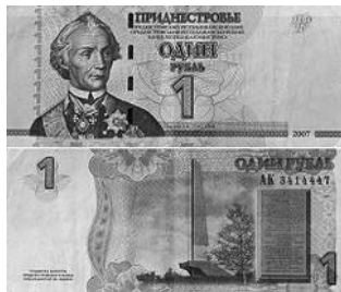
Transdnestria 1 Rublo 2007 Mariscal Suvorov

Република Молдовеняскэ Нистрянэ / Republica Moldovenească Nistreană / Приднестрoвская Молда́вская Респу́блика / Pridnestróvskaya Moldávs'kaya Respúblika Придністрoвська Молда́вська Республіка / Prydnistrovs'ka Moldavs'ka Respublika República Moldava Pridnestrovia