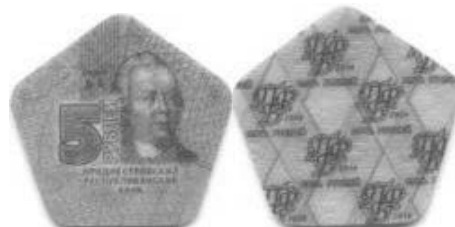
Transdnestria 5 Rublos 2014 Gral. Piotr A. Rummyantsev-Zadunaisky