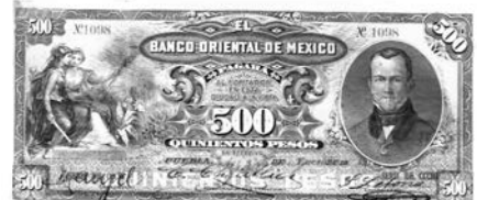
Minerva e Irene, la Guerra y la paz. Detalle del billete del Banco Oriental de México de 500 pesos (Puebla, México, 3 de enero de 1914).

Su contraparte Irene, a quien en la mitología romana se le conoce como Pax, simboliza la paz como la condición virtuosa de la convivencia humana. Junto a sus hermanas, forma las Horas, personificando la primavera, el verano y el invierno. Se le representa como una mujer hermosa con expresión dulce y aspecto gentil, lleva en una de sus manos el Cuerno de la Abundancia y un ramo de olivo; en otras representaciones aparece con una vara de