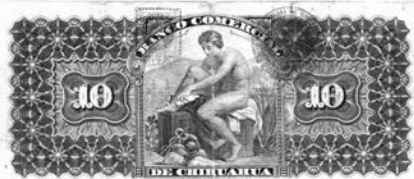
Mercurio, dios del comercio. Detalle del reverso del billete del Banco Comercial de Chihuahua de 10 pesos (Chihuahua, México).

antigua Roma los mercaderes debían comenzar sus negocios con el canto de este animal.