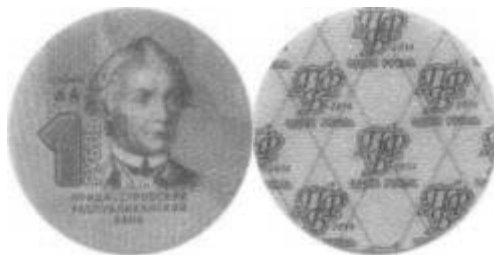
Transdnestria 1 Rublo 2014 Mariscal Suvorov