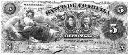
Ceres, diosa de la agricultura. Detalle del billete del Banco de Coahuila de 5 pesos (Coahuila, México, 15 de febrero de 1914).

Por lo general, Ceres se representa como una mujer hermosa, vestida con holgadas túnicas, de cabello rubio que cae sobre sus hombros, con una corona de espigas de trigo o una diadema muy alta; porta un haz de espigas en la mano derecha y una antorcha encendida en la izquierda; también suele aparecer rodeada de frutos, plantas y animales. Como símbolo de fertilidad, se le representa con un cetro o una hoz, o bien con niños pegados a sus senos y sosteniendo el Cuerno de la Abundancia.