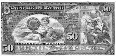
Eleutheria, personificación de la Libertad. Detalle del billete del Banco de Durango de 50 pesos (Durango, México, febrero de 1914).

Eleutheria, conocida también bajo el nombre de Libertas en la mitología romana, era la diosa y personificación de la libertad. Debido a que ha servido de inspiración para muchos símbolos de la libertad y emancipación, se