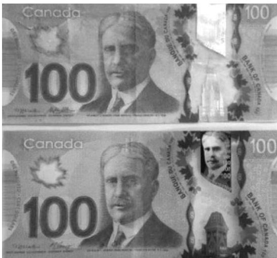
Comparación del billete falso de 100 Dólares realizado con la banda holográfica de uno de 5 Dólares (arriba) y uno original (abajo).

Si bien es cierto que la producción de billetes falsos en Canadá se ha desacelerado drásticamente en los últimos tres años, aún con sus modernos billetes de polímero están teniendo que lidiar con el ingenio de los falsificadores.