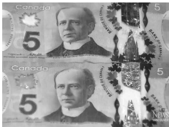
Billete original de 5 Dólares (arriba) y uno adulterado con papel metalizado (abajo).

La policía en Vancouver ha descubierto el año pasado que había criminales alterando los nuevos billetes plásticos para crear falsificaciones que luego son introducidas en el mercado. La Real Policía Montada Canadiense y el Banco de Canadá están advirtiendo a los comerciantes que los delincuentes están cortando billetes de cinco dólares para retirar la banda holográfica que luego es pegada en fotocopias o impresiones caseras de billetes de $100, para hacerlas menos sospechosas. A éstos luego le aplican algún tipo de plastificado para que luzcan al tacto similares a los originales. A su vez, luego reparan el billete de $5 colocándole recortes de papel metalizado entre dos tiras de cinta adhesiva transparente, para no desperdiciar nada.